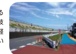
堤内地の浸水予防イメージ

地震発生から浸水・湛水に至るプロセスに応じて有効な水防技術・修復技術を活用して被害軽減を図るための研究開発を行います。