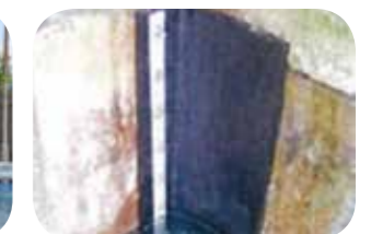
特殊堤目地開き部の漏水防止イメージ