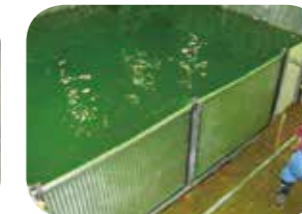
ハイブリッドパネル堤