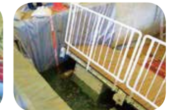
フローティング止水デッキ