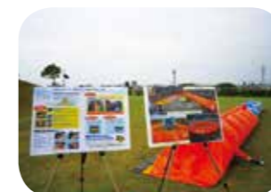
水防演習・講習会への参加協力

このプロジェクトでは、「スーパー川守」の活動を支援し、情報の共有や現場ニーズに応じた技術提供を通じて、地域防災力の強化に貢献するための活動に取り組みます。