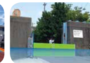
陸開部の浸水予防イメージ