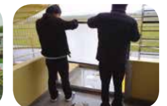
モバイルレビーの技術協力