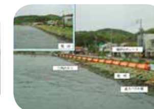
治水・水防の課題情報共有と協働